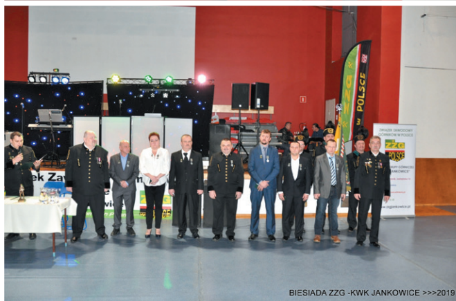
BIESIADA ZZG - KWK JANKOWICE >>>2019