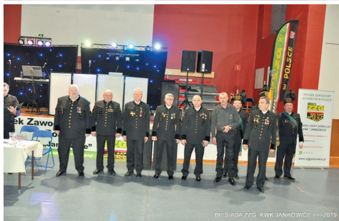
BIESIADA ZZG - KWK JANKOWICE >>>2019