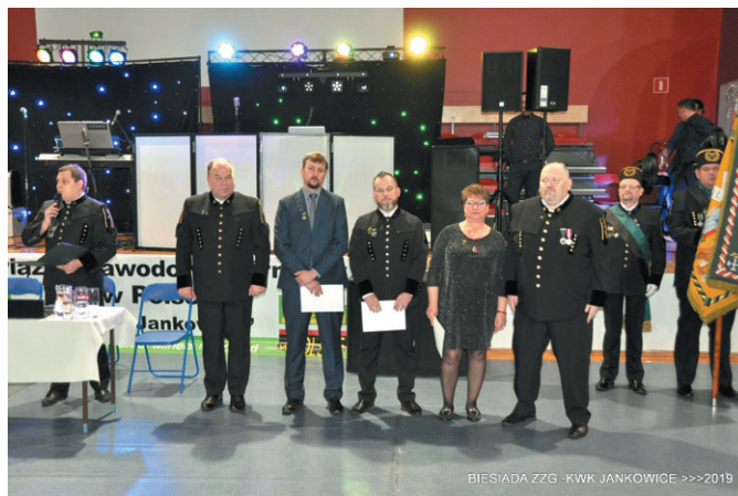
BIESIADA ZZG - KWK JANKOWICE >>>2019