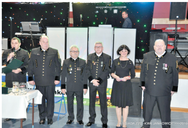
BIESIADA ZZG - KWK JANKOWICE >>>2019