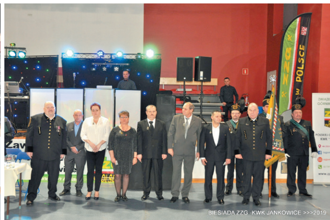
BIESIADA ZZG - KWK JANKOWICE >>>2019