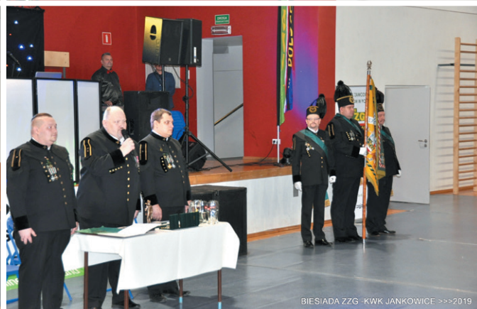
BIESIADA ZZG - KWK JANKOWICE >>>2019