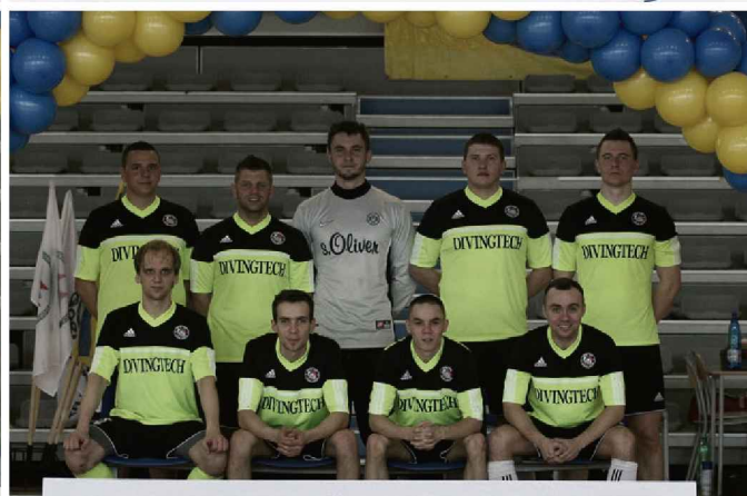
BARBÓRKA CUP 2014