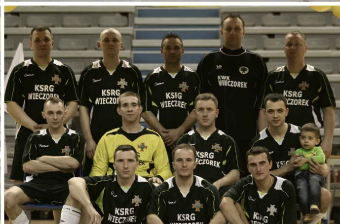
BARBÓRKA CUP 2014