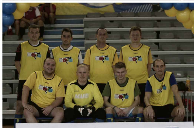
BARBÓRKA CUP 2014