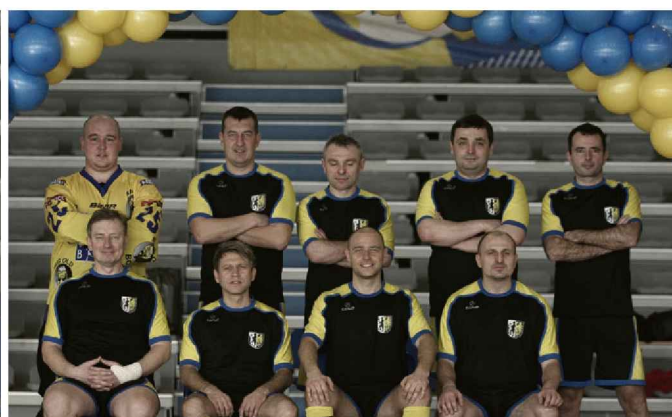
BARBÓRKA CUP 2014