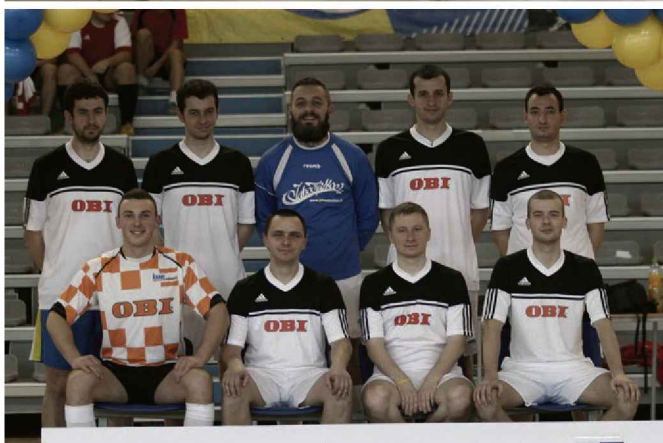
BARBÓRKA CUP 2014