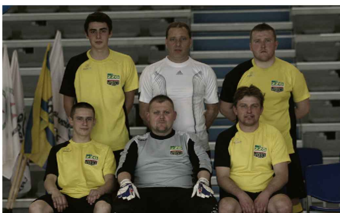
BARBÓRKA CUP 2014