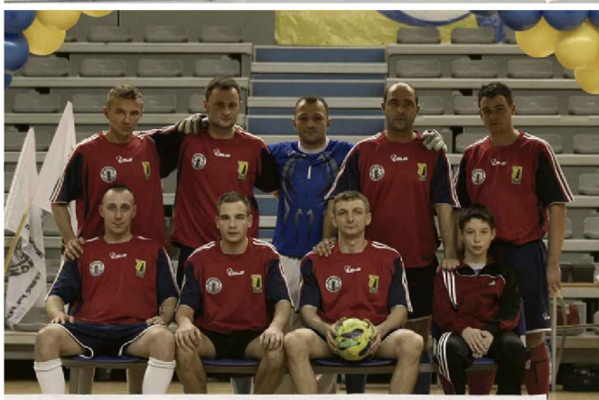
BARBÓRKA CUP 2014