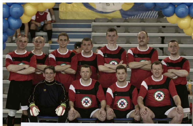
BARBÓRKA CUP 2014