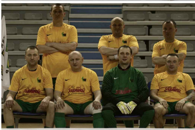
BARBÓRKA CUP 2014