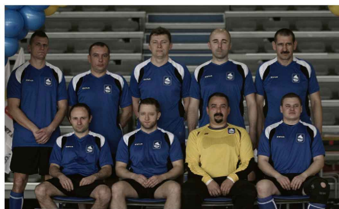
BARBÓRKA CUP 2014