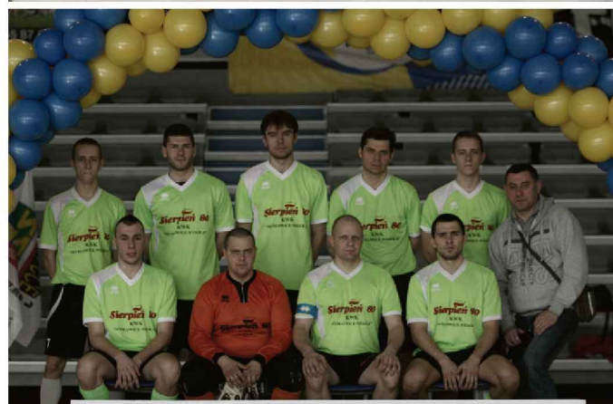
BARBÓRKA CUP 2014