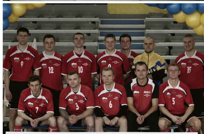
BARBÓRKA CUP 2014