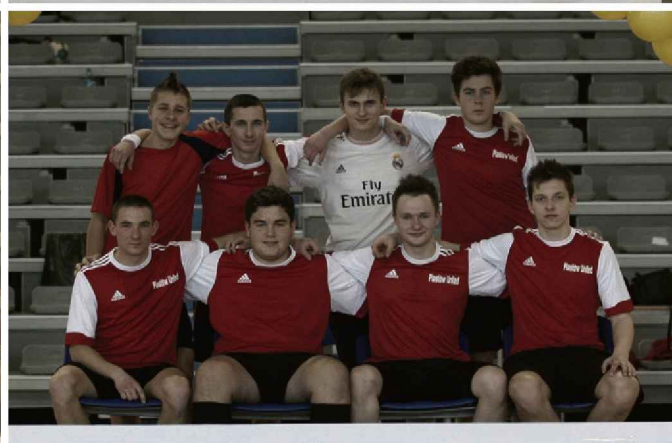
BARBÓRKA CUP 2014