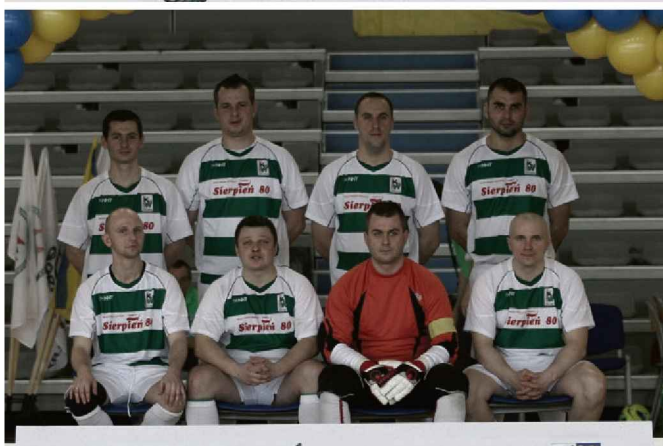
BARBÓRKA CUP 2014