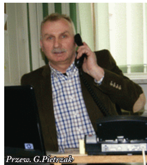
Przew. G. Pietrzak

płac na stawkach zasadniczych. Polityka zarządzania Kopalni, która obecnie dopasowywana jest do realnej rzeczywi-