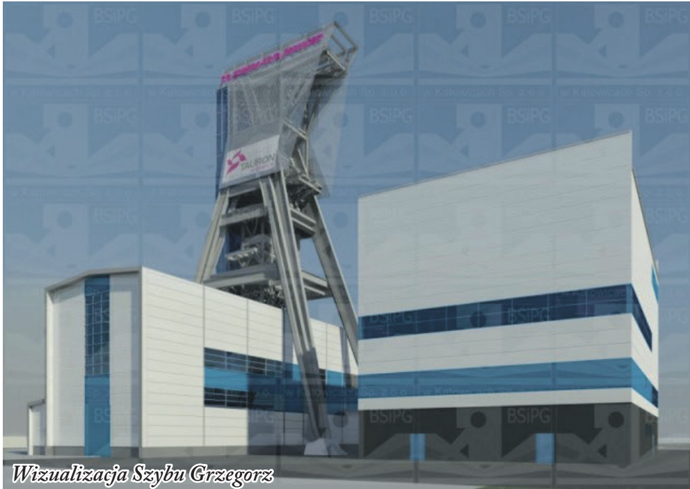
Wizualizacja Szybu Grzegorz